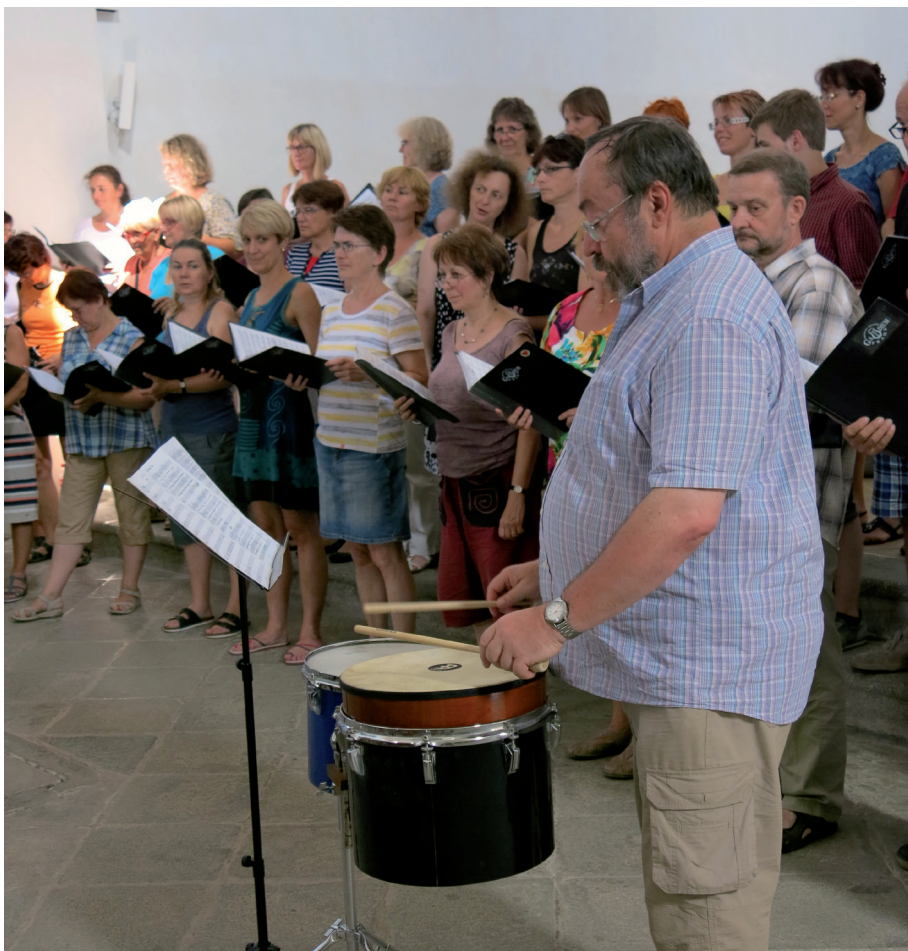
Foto ze zkoušky před koncertem v Milevsku 2015