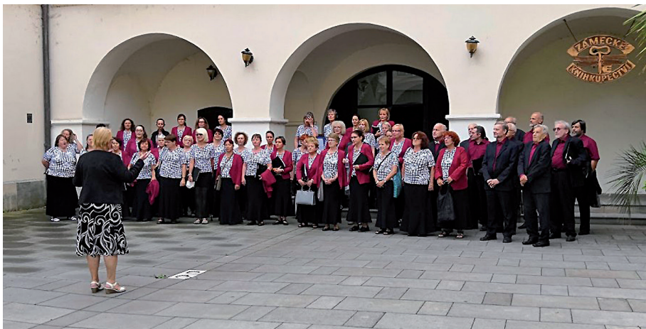
Na nádvoří Chocenského zámku