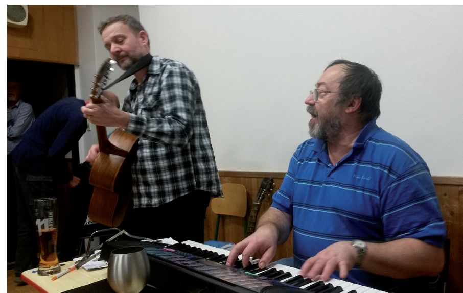
Na soustředění v Loutí